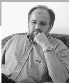
Autor: dr Srđan Darmanović